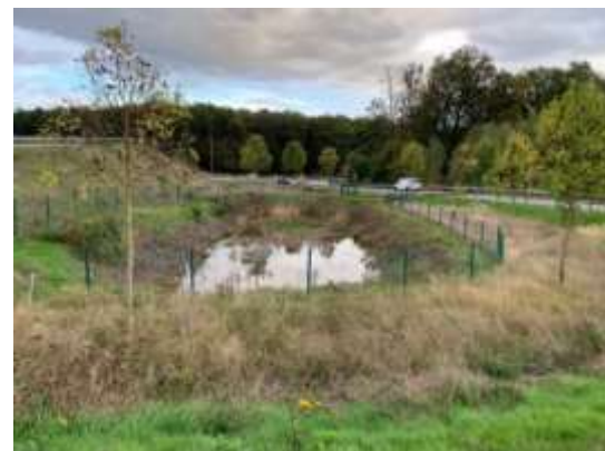
Autobahnzufahrt Meudt-Montabaur 4.000 m 2