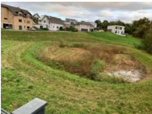
Wohngebiet hinter FOC ca. 25 Häuser 4.000 m 2