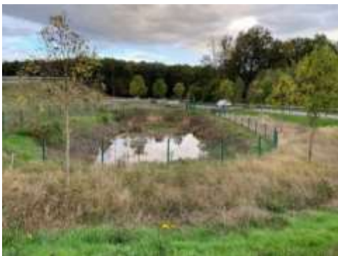
Autobahnzufahrt Meudt-Montabaur 4.000 m 2