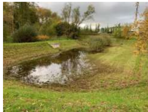
Parkplatz FOC Montabaur 5.000 m 2