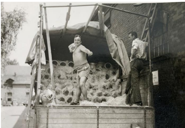
Transport und Stroh Verpackung von Graublau Ware

Nach dem 2. Weltkrieg wurde der Ton mit LKW's befördert und Ebernhahn war jahrelang das Dorf mit den meisten LKW pro Einwohner. Bis heute sind mehr als 250 LKW und Busse ständig aus Ebernhahner Familien unterwegs. Vom reinen Tontransport mit Ochsendgespann wurde das Frachtgeschäft mit Keramikware aus dem Westerwald ausgebaut. 1939 wurde die Keramik noch in Stroh auf den LKW verpackt, Gitterboxen, Pappkarton auf Paletten und Stapler folgten Jahre später. LKW-Fahrer war ein harter, gut bezahlter Beruf, man sah andere Menschen, Firmen, Möglichkeiten und bekam Kontakte die Geschäfte zu erweitern.