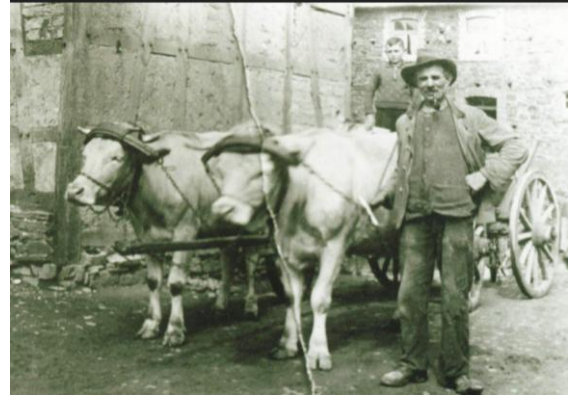
Förderung im Glockenschacht Tone im Westerwald