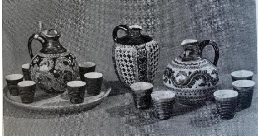
Likörservice mit Redtechnik, Töpferei Krämer Höhr Ringstr.

Während seiner Studentenzeit hat er ein breites Sortiment, zunächst für die 68 Studenten herstellt, was sich aber vor dem Rauchen in Glaskolben als neue Geschäftsidee in weisem Steingut gegossen, glasiert, bei 1250 grad C gebrannt und ab 1974 durch die türkischen Shisha-Café's ersetzt wurden.