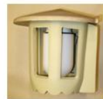
Ampel Nr. 2 Artikel 01002 Höhe ca. 28 cm Ø 32 cm Gewicht 3,5 kg Preis 165,- €