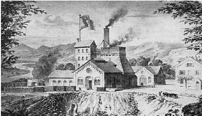
Mühlhofener Hütte mit einem Hochofen Bendorf

1770 wurde in Sayn durch das Kurfürstentum Trier das erste Stahlwerk mit Hochofen unter Clems Wenzeslaus betrieben. 1803 wurde rechts rheinisch preußisch/nassauisch und die Fam. Remy hat in Bendorf am Rhein das damals bedeutendste Hochofenwerk Concordia in Betrieb genommen. Der Ton aus Ebernhahn wurde in der Concordia Ransbach für die Hüttenwerke zu Schamotte gebrannt. Die ersten Eisenbahn Schienen für die erste Eisenverbindung Nürnberg-Fürth wurden im Werk Rasselstein hergestellt. 1865 hat die Fam. Krupp beide Hüttenwerke nebst den Eisenerzgruben übernommen und als Lieferant für den Aufbau des Werkes in Essen zu fungieren. Die Tonvorkommen mit Schamottebrand wurden von Fam. Ludwig übernommen.