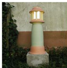
Florenz mit Sockel