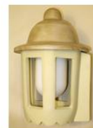
Ampel Nr. 3 Artikel 01003 Höhe ca. 40 cm Ø 26 cm Gewicht 3,5 kg für Hausecke Preis 165,- €