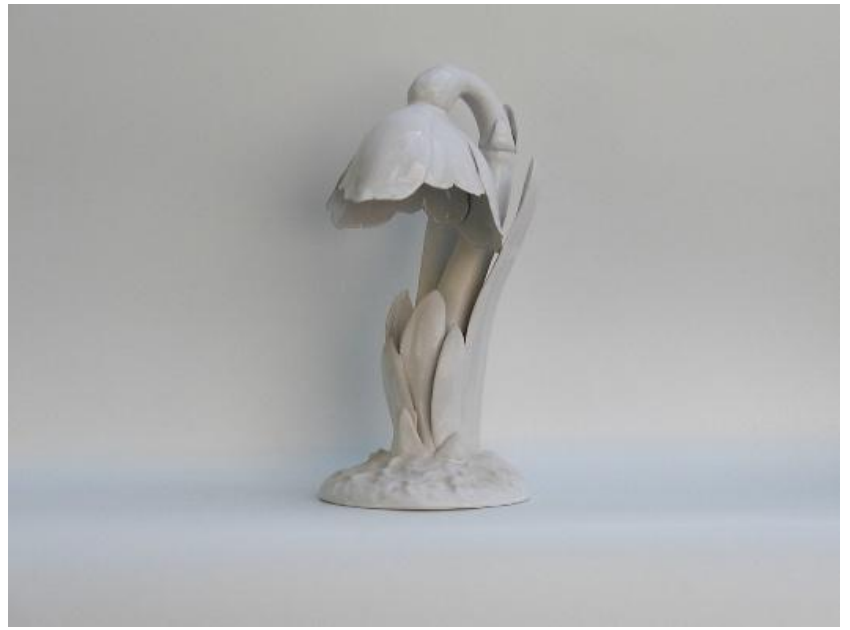
Siegfried Zipp ein paar Bilder und einige seiner Entwürfe