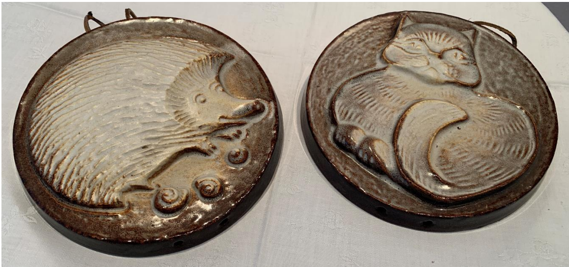
Tierfiguren Teller z.B. für die Wanderfreunde Ebernhahn auch im Programm