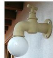
Wasserhahn Artikel 01001 Höhe ca. 58 cm Gewicht 6,5 kg Preis 219,- €