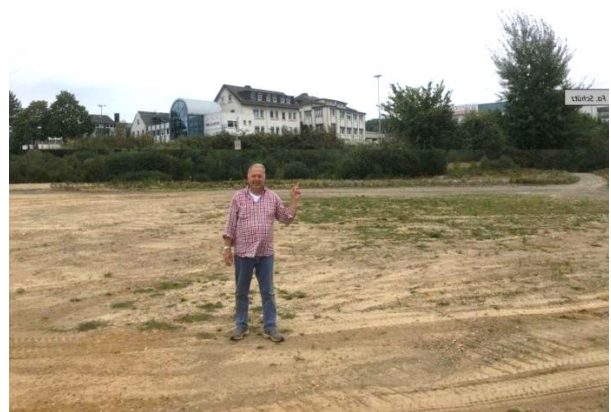
Grube Gottesgabe Ortsausgang Ebernhahn, hinten TH Goldschmidt, ab 1970 verfüllt, hinten Steuler/Systemkeram/Fa. Schütz,

Dieser Ton und der Schamottebrand machte es möglich hoch feuerfeste Steine für die Eisenverhüttung herzustellen, der in den letzten 60 Jahren durch höherwertigere Rohstoffe ersetzt wurde.