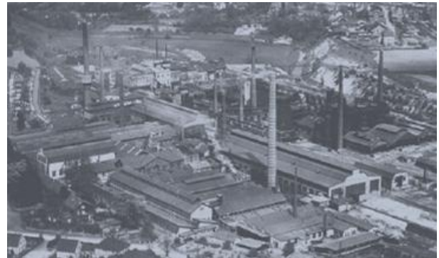
Concordia Hütte Bendorf mit 3 Hochöfen

Nach dem 2. Weltkrieg wurde der Ton mit LKW's befördert und Ebernhahn war jahrelang das Dorf mit den meisten LKW pro Einwohner. Bis heute sind mehr als 250 LKW und Busse ständig aus Ebernhahner Familien unterwegs. Vom reinen Tontransport mit Ochsendgespann wurde das Frachtgeschäft mit Keramikware aus dem Westerwald ausgebaut. 1939 wurde die Keramik noch in Stroh auf den LKW verpackt, Gitterboxen, Pappkarton auf Paletten und Stapler folgten Jahre später. LKW-Fahrer war ein harter, gut bezahlter Beruf, man sah andere Menschen, Firmen, Möglichkeiten und bekam Kontakte die Geschäfte zu erweitern.