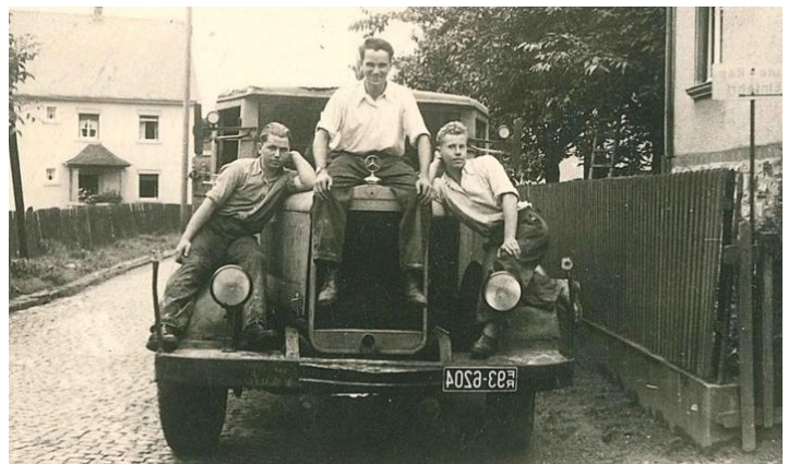
1950 erster LKW der Firma Schenkelberg